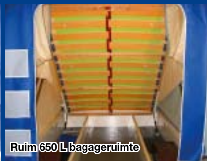
Ruim 650 L bagageruimte