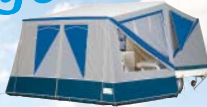
Tago Settler met voorwand geheel uitneembaar