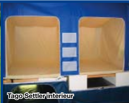
Tago Settler interieur