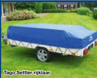
Tago Settler rijklaar