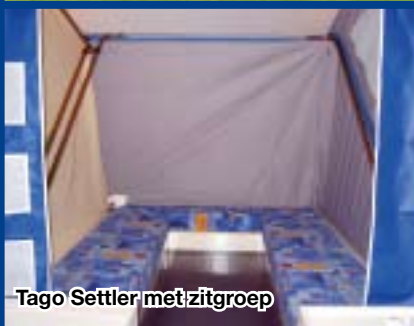
Tago Settler met zitgroep